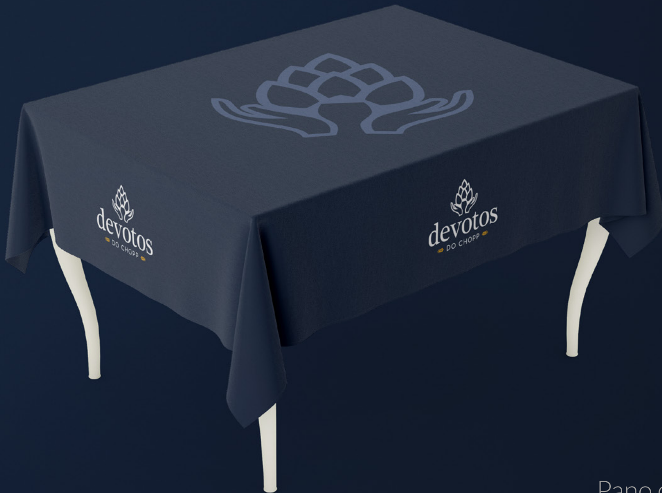
Pano de mesa